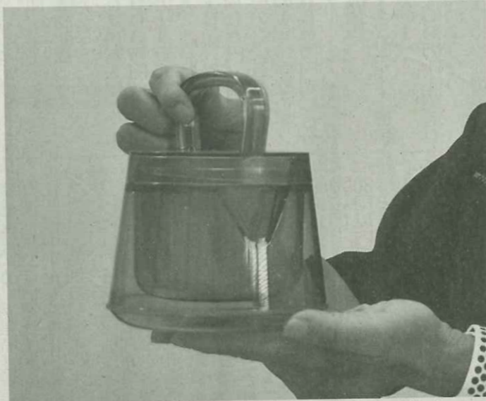
自動車部品の技術生かした急須(鈴木化学工業所)

部品製造の技術を活 用して製造・販売を始 める。中小製造業とサ イターの間で5回以上 の年間5回以上のマ イナリーチェンジを 実施。小幡社長は中 途半端な製品は作れ ない。より使いやすい 製品をより使いやすい 製品をより使いやすい 製品をより使いやすい